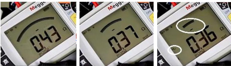
Úvodné meranie (4sek)

Nový Indikátor spoľahlivosti merania impedancie vypínacej slučky v podobe oblúkového bargrafu priebežne počas merania indikuje spoľahlivosť výsledku a mieru vplyvu rušenia na výsledok. Pri zarušenom obvode a nestabilnom výsledku automaticky indikuje prítomnosť rušenia, vykoná korekciu, až po dosiahnutie stabilného spoľahlivého výsledku (oblúkový bargraf sa zminimalizuje).